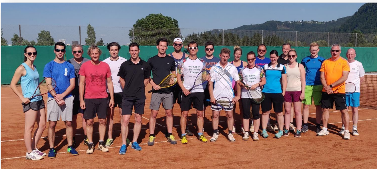
Die Teilnehmer der diesjährigen Konzernmeisterschaft!