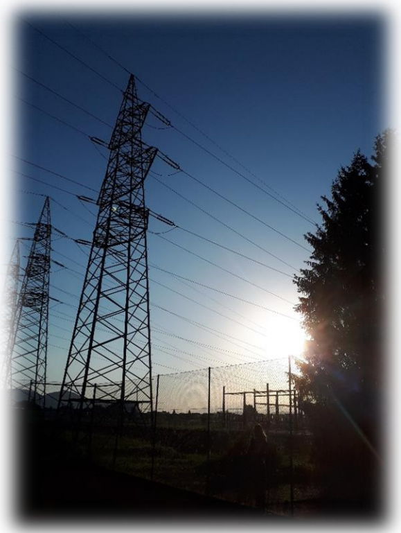
Ein kraftvoller Ort mit wunderschönen Sonnenuntergang ☺

Für das Team Badminton / Squash Markus Pirker-Rodrix