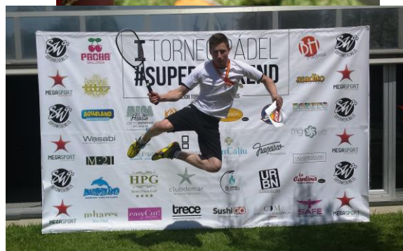
Bild: die überglücklichen BSK-Jungs bei der Medaillenübergabe