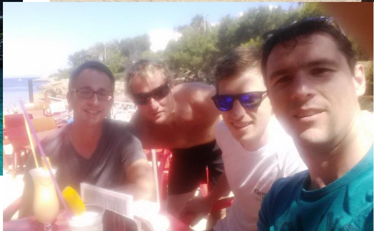
Bild: Impressionen von Mallorca

Am Anstusstag wurde der beste jemals erzielte sportliche Erfolg des BSK Kelag Squash Teams bei der Abschlussfeier in Palma ausgiebig gefeiert.