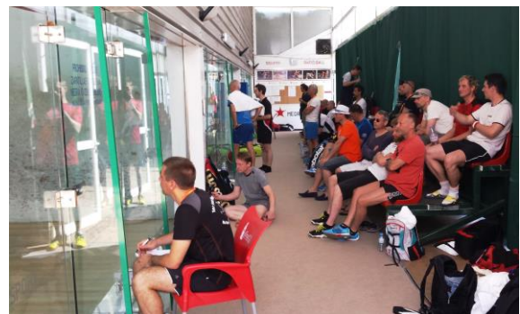
Bild.: die perfekte Sportanlage